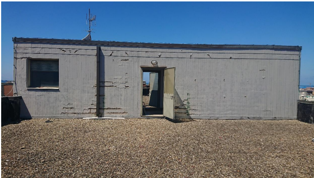
Struttura in elevazione sulla copertura

Anch'essa, realizzata in cemento armato, presenta notevoli e marcati distacchi sui copriferri, causati per lo stesso problema e ancora più esposto agli agenti atmosferici risultando più in alto dei palazzi circostanti.